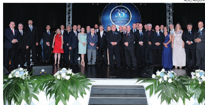
Homenageados na 35ª edição do Dia da Empresa Limeirense, em 2015

“Homenageamos aqueles que mais se desportaram durante o ano, as empresas e empresários que conseguiram se superar perante os desafios, que inovaram, buscaram a melhoria contínua de seus negócios, atuando com competência e muita determinação para que alcançassem o sucesso”, ressalta o presiden-