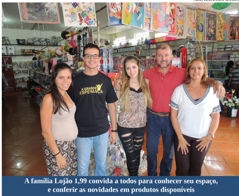
A família Lojão 1,99 convida a todos para conhecer seu espaço, e conferir as novidades em produtos disponíveis

O Lojão 1,99 atende a todo tipo de público, do infantil ao adulto, a maioria localizada em bairros. “Nosso compromisso é com o menor preço possível, focando em compras bem feitas pa-