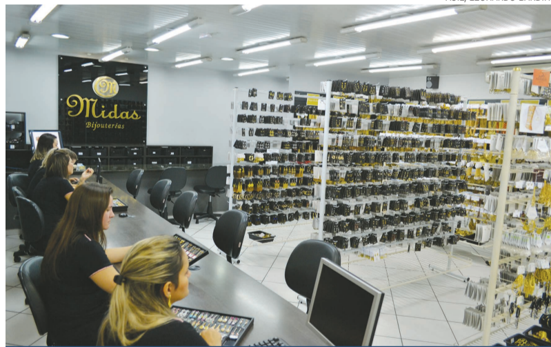
Na Midas Bijouterias o consumidor encontra atendimento personalizado e mercadorias diferenciadas

A Midas Bijouterias convida a todos para conhecerem a grande variedade de bijouterias brutas, peças diferenciadas em alta fusão, cristais, zircônias, dentre outros produtos oferecidos pela empresa. Ela está localizada na Av. Mal. Arthur da Costa e Silva, 1310 (loja 16), no Jardim Glória. Seu horário de funcionamento é de segunda à sexta-feira das 8h às 18h, e aos sábados das 9h às 13h. Para mais informações existe o número (19) 3453-2399, o Whatsapp (19) 99840-2399 e o e-mail contato@midasbijouterias.com.br .