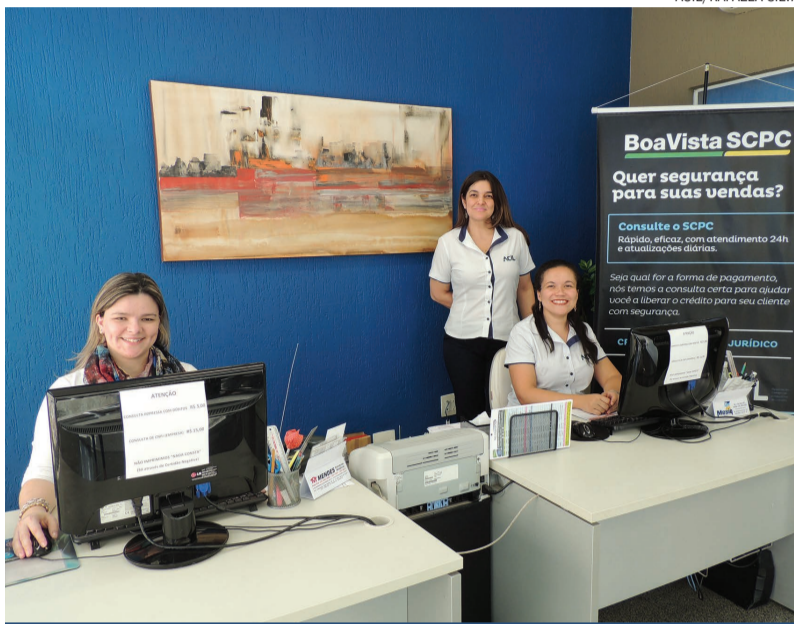
A equipe do SCPC da ACIL está à disposição para assessorar o associado caso haja dúvidas sobre os serviços oferecidos

Para conhecer todos os produtos e ferramentas oferecidas pelo SCPC para auxiliar na análise do consumidor e liberação de crédito, o associado da ACIL pode acessar o site da entidade www.acillimeira.com.br e clicar no link de acesso ao SCPC. Dessa forma é possível conferir todas as novidades e ter acesso a várias informações que com certeza vão ajudar o sócio da ACIL no dia a dia de sua empresa. Também é possível entrar em contato para tirar dúvidas sobre os produtos ou acesso ao sistema pelos telefones 3404-4949 e 3404-4929.