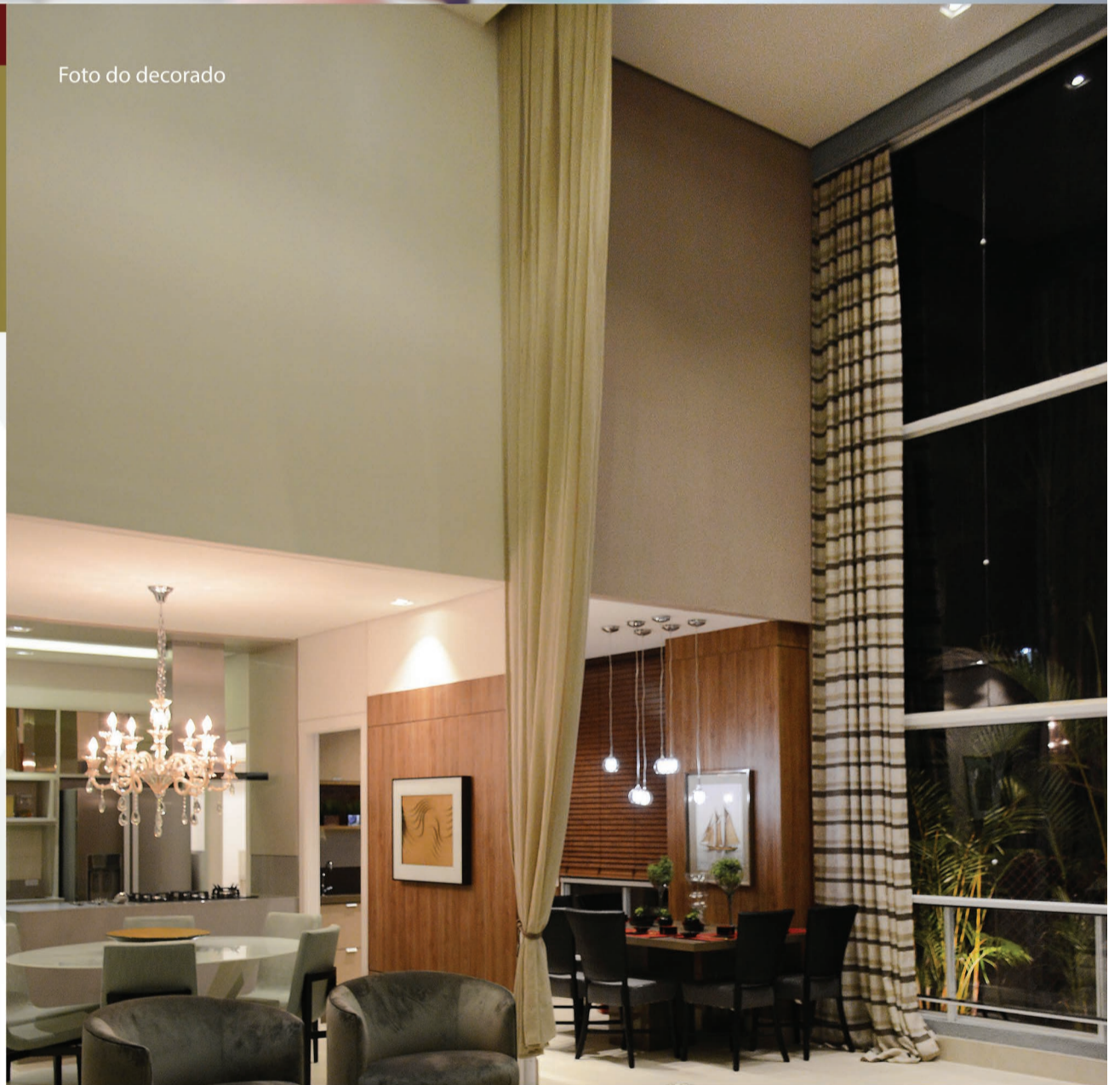
Foto do decorado

*O número de vagas irá depender do andar escolhido.